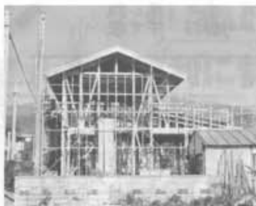
南松原 半田 真様 住宅新築工事