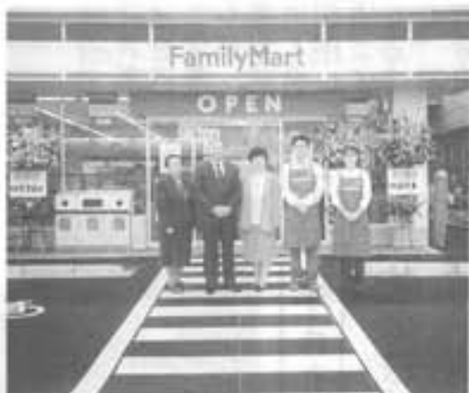
補給 (有) コバヤシ様 店舗新築工事