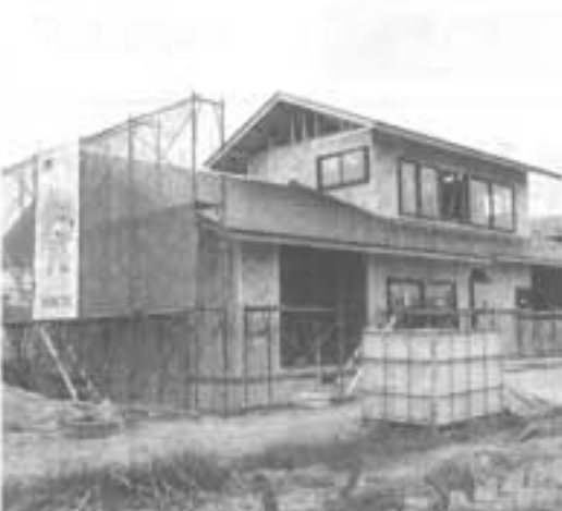
馬上台 安達 功様 住宅新築工事