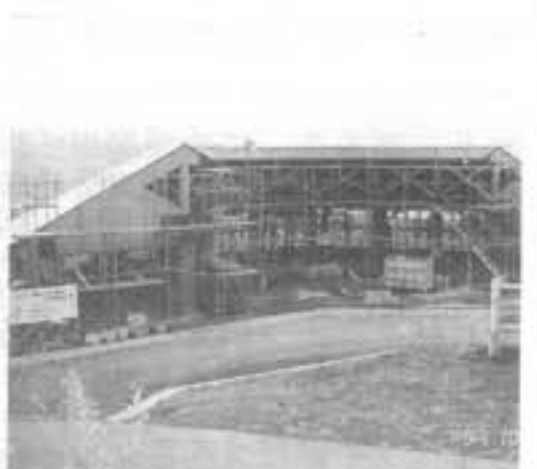
「西蔵王市民の森林」 休憩施設新築工事