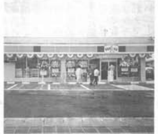
城西 (有) 丸喜開発様 貸店舗新築工事