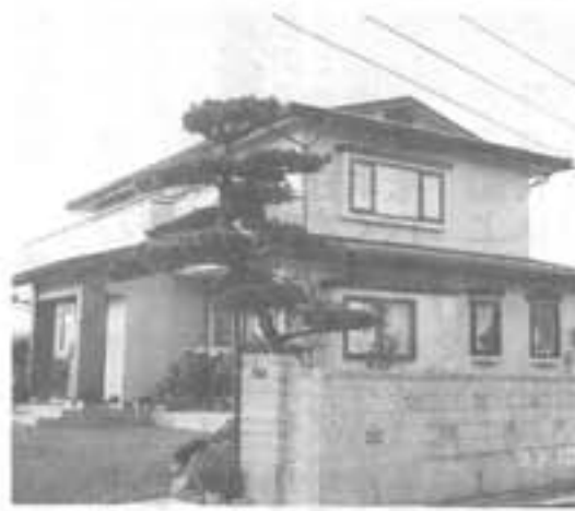
陣場 高橋忠一・繁尚様 住宅新築工事