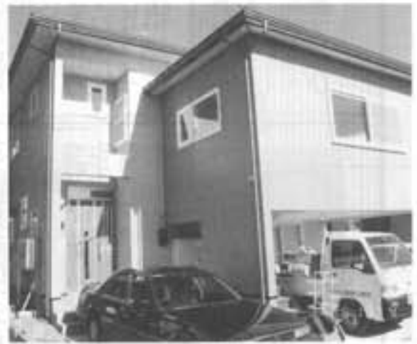
成沢団地 草苺隆志様 住宅新築工事