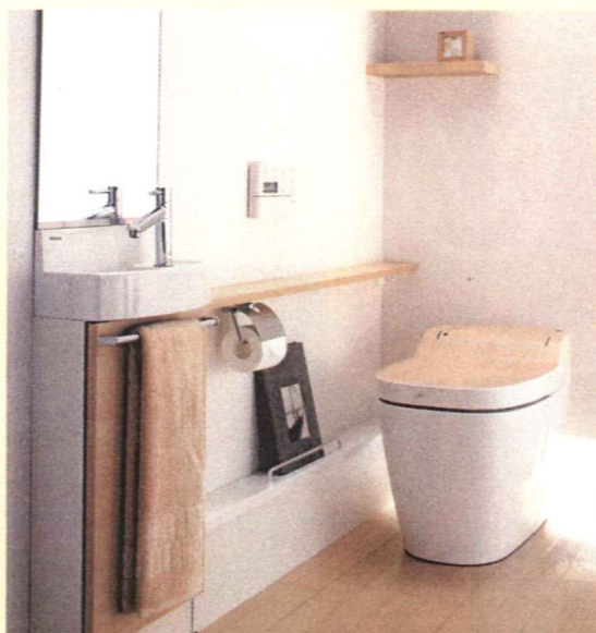
全自動おそうじトイレ アラウーノ [リフォームタイプ]